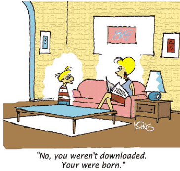
Figure 1. A typical figure [Helvetica, tamanho 10, negrito, centralizado]